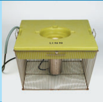
Aqua-Hobby mit Tauchmotor