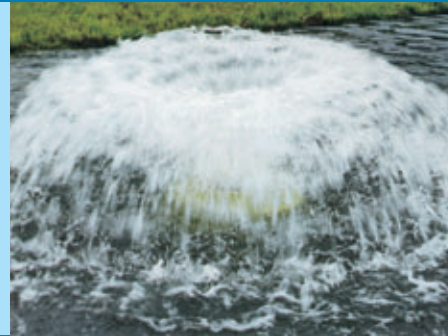
... für Fisch-, Park- und Zierteiche