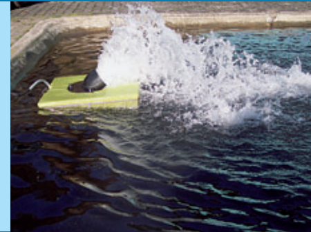
Aqua-Hobby mit Tauchmotor – mit zusätzlicher Auswurfhaube